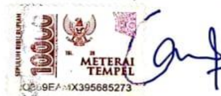
Beatrix Putri Gadis Sainyakit